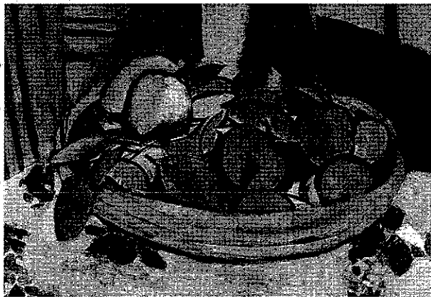
Henri Matisse, Bodegón con naranjas (fragmento).