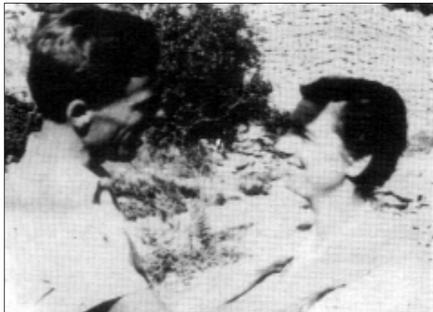
1942. Salida de la prisión. Con su esposa

Unos meses después de la Licenciatura, en julio de 1928, consigue aprobar las oposiciones para Catedrático de Instituto . En la Francia de 1928, con veintitrés años, era un privilegio encontrarse en esa situación social y académica, pero Mounier ya caminaba con tres heridas: La de la vida, la de la muerte y la del amor .